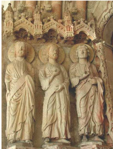
Paderborner Dom, Paradiesportal

Die im Folgenden empfohlene Route hat nur bis zur durchgehenden Fertigstellung des historischen Pilgerweges Gültigkeit.